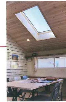
奥さまの趣味のフラワーアレンジメントスペース。勾配天井の小屋根空間はトップライトから空が見え、「時間を忘れて没頭できる」と奥さま。