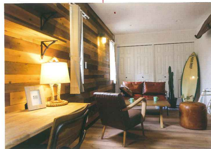
リビングに隣接するご主人の書斎。将来、寝室として使うことを考慮して、2カ所の出入り口は引込み戸になっている。ホームパーティーに使用するときにも便利だという。