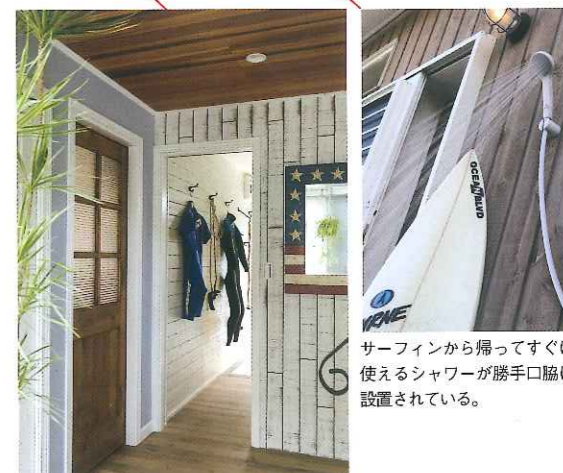
ウェットスーツのまま勝手口からユーティリティ、洗面・脱衣室、浴室へ行ける動線が確保されている。