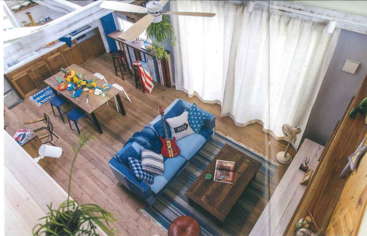
「光と風、海を感じる」がコンセプトのLDK。大きな窓、木の内装やエイジング塗装、青色のカラーコーディネート、そしてヴィンテージ風の家具やファブリックなどがデザインのポイントになっている。

当社が目指すのは、欧米のように100年後も資産価値のある住まい。米国のマスタープランの設計とランドスケープデザインの手法を取り入れたツーバイフォー住宅を提案しています。また、100年間の定期借地権を活用し安心かつリーズナブルな価格で、美しい街並みと質の高い世界標準の住宅を供給する街並み分譲地プロジェクトが2008年第1回超長期先導的モデル事業(200年住宅)に選ばれました。これからもお客さまの視点に立ち、3世代にわたる資産価値のある家づくりに尽力し、信頼に応えたいと思います。