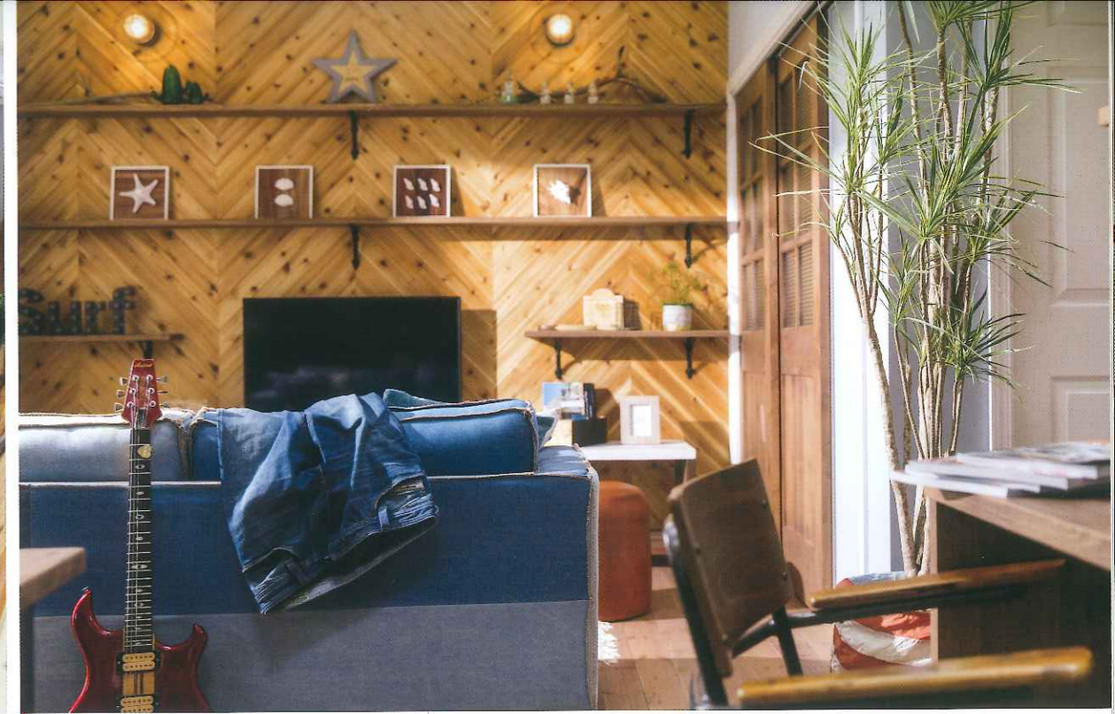
リビング西側の壁面は板張りで飾り棚が設置されている。個性的で木目の美しさが際立つV字形のヘリンボーンパターンが採用されている。