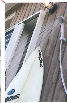
サーフィンから帰ってすぐに使えるシャワーが勝手口脇に設置されている。